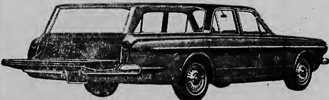
1963 VALIANT, S.W.